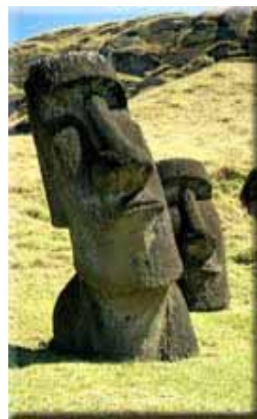
Isla de Pascua