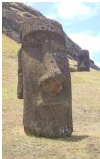
Isla de Pascua